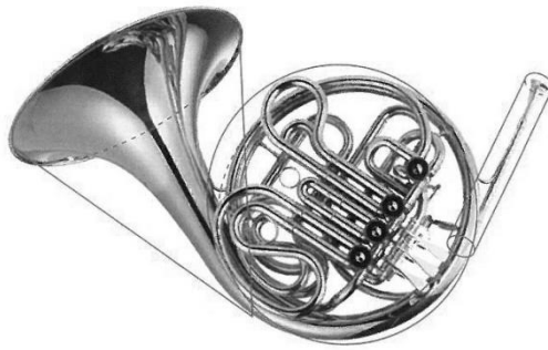
ホルン=円すい+円+円柱