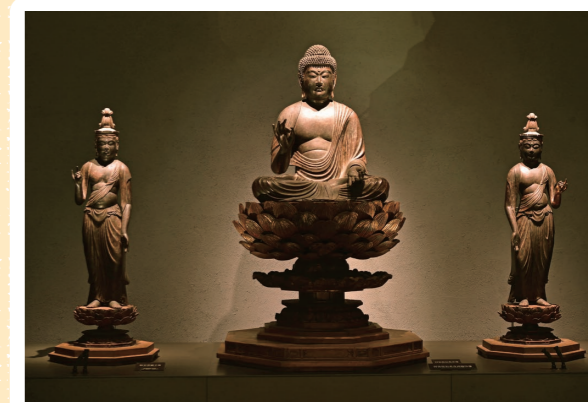
1 かなみ仏の里美術館: 函南町 (重文: 木造阿彌陀如来及び両脇侍像(実慶作)) 詳しくはコチラ▶