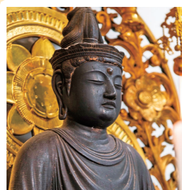
10 一乗寺: 静岡市清水区 (県文: 木造阿彌陀如来坐像) 詳しくはコチラ▶