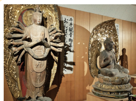
3 摩訶耶寺: 浜松市北区 (重文: 木造千手観音立像・ 県文: 木造阿彌陀如来坐像) 詳しくはコチラ▶

◆ 仏像は信仰の対象です。仏像を大切にしている気持ちを忘れずに拝観させてもらいましょう。 ◆ 各寺院の行事や住職さんの都合により拝観できないことがあります。事前に各寺院に問い合わせましょう。