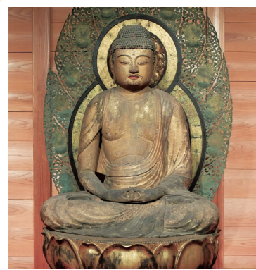
1 応賀寺: 湖西市 (県文: 木造阿彌陀如来坐像) 詳しくはコチラ▶