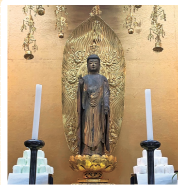
8 宝台院: 静岡市葵区 (重文: 木造阿彌陀如来立像) 詳しくはコチラ▶