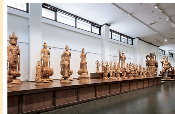
3 上原美術館(仏教館): 下田市 詳しくはコチラ▶