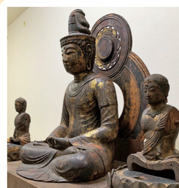
12 伊豆山神社: 熱海市 (県文: 木造阿彌陀如来及び両脇侍坐像) 詳しくはコチラ▶