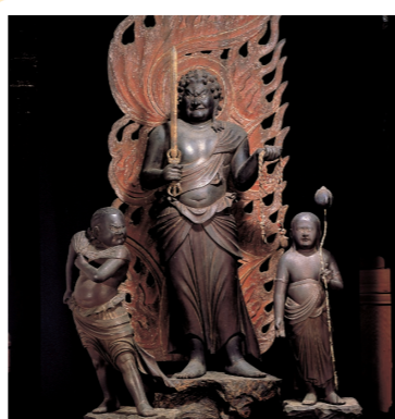
11 願成就院: 伊豆の国市 (国宝: 木造不動明王及び二童子立像 (運慶作)) 詳しくはコチラ▶