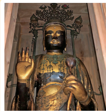
7 法華寺: 焼津市 (県文: 木造聖観音立像)