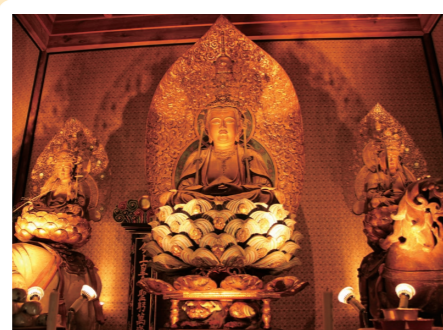
4 方広寺: 浜松市北区 (重文: 木造釈迦如来及び両脇侍坐像 (院吉、院広、院遵作)) 詳しくはコチラ▶