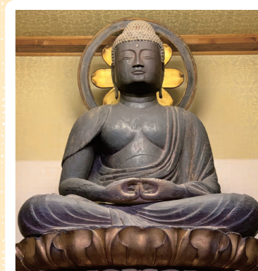
14 長谷寺: 下田市 (重文: 木造阿彌陀如来坐像)

◆ 仏像は信仰の対象です。仏像を大切にしている気持ちを忘れずに拝観させてもらいましょう。 ◆ 各寺院の行事や住職さんの都合により拝観できないことがあります。事前に各寺院に問い合わせましょう。