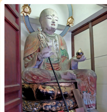
5 宣光寺: 磐田市 (県文: 木造地藏菩薩坐像)