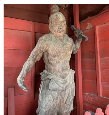
2 大福寺: 浜松市北区 (県文: 木造金剛力立像)