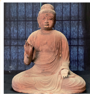
6 西楽寺: 袋井市 (県文: 木造阿彌陀如来坐像) 詳しくはコチラ▶