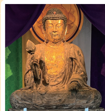
13 修禅寺: 伊豆市 (県文: 木造釈迦如来坐像) 詳しくはコチラ▶