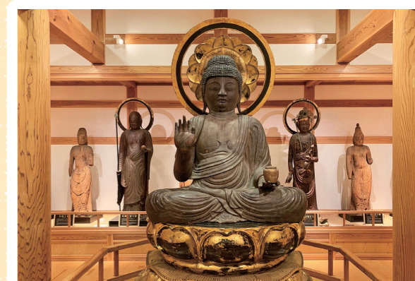
2 河津平安の仏像展示館: 河津町 (重文: 木造薬師如来坐像) 詳しくはコチラ▶