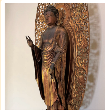
9 新光明寺: 静岡市葵区 (重文: 木造阿彌陀如来立像)