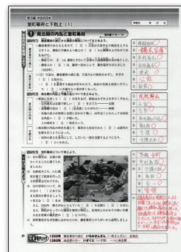
▲研究ノート(問題ドリル)

教師が板書すると生徒はひたすら書き写す作業をします。教師が肝心な説明や解説を伝えようとしても聞くのが困難です。教室には多様な生徒が存在しています。中には一つの作業をやるのが精一杯で、授業を聞くこともなく終わってしまう生徒もいます。そこで「板書プリント」を事前に準備しておくことで授業に集中できるようになります。授業の最後には、振り返りの時間として「研究ノート」の左ページにある「問題ドリル」を5~7分程度かけて確認し、時間に余裕があれば丸付け作業まで行います。授業時間での疑問や十分理解できなかったことを見直すことで、自宅の復習時に再度「研究ノート」を開いて振り返る習慣が身につく、更なる学力向上に繋がります。